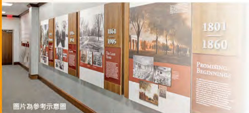
圖片為參考示意圖