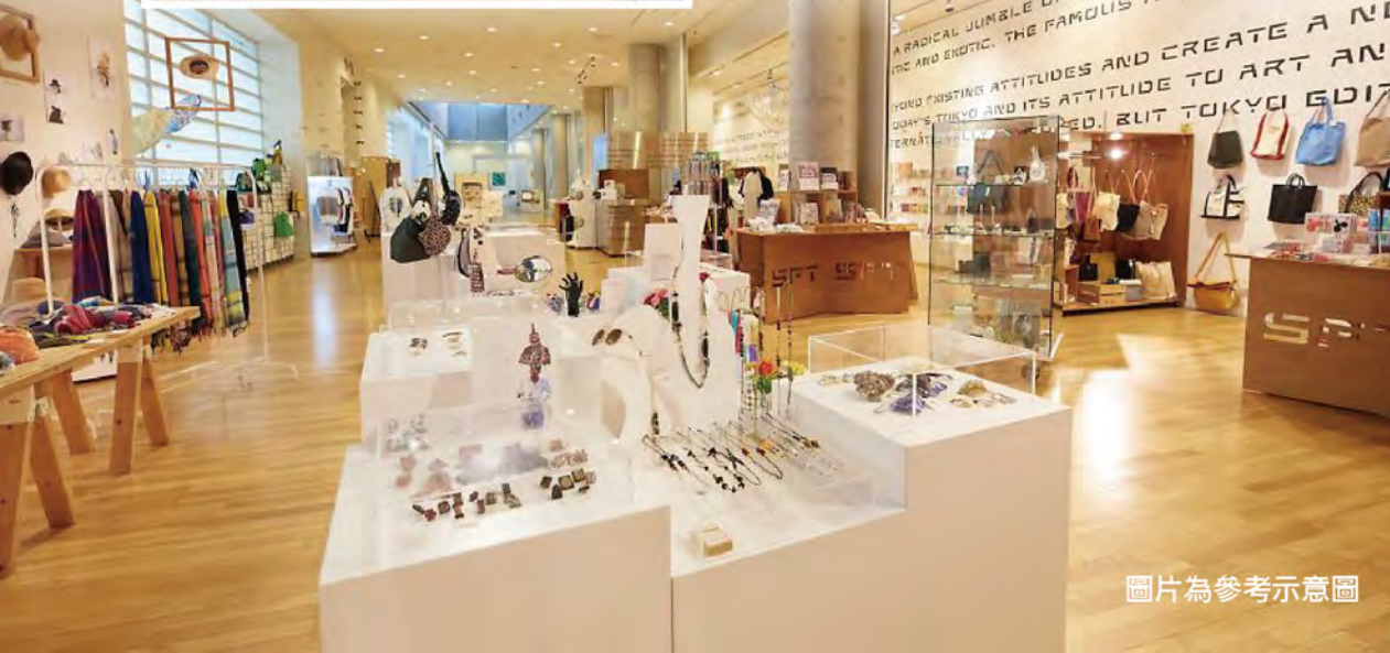
圖片為參考示意圖